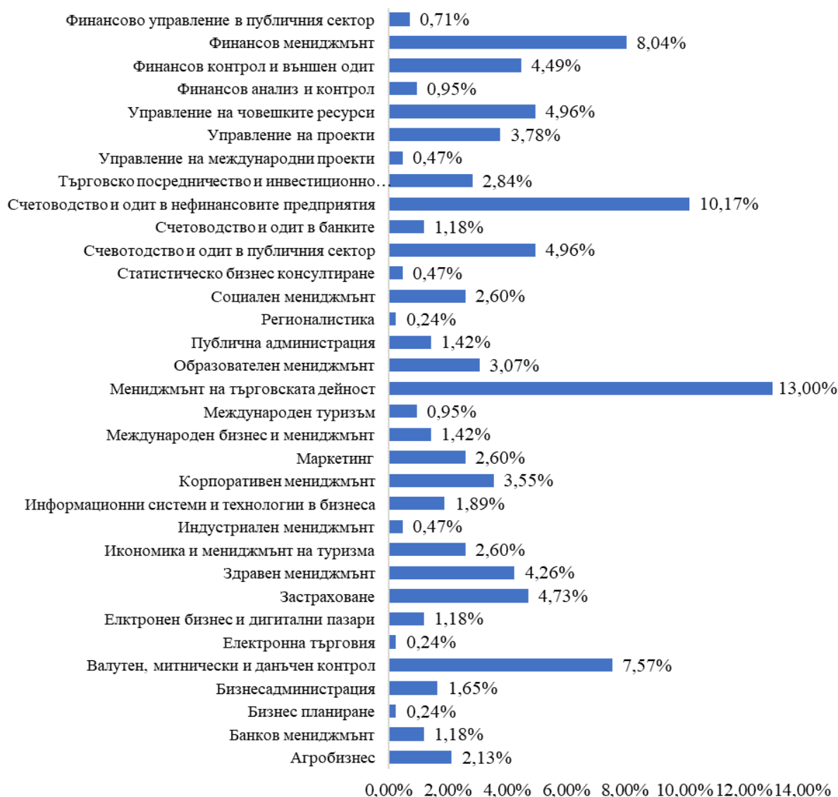
Фигура 2. Разпределение на анкетираните студенти по магистърски програми