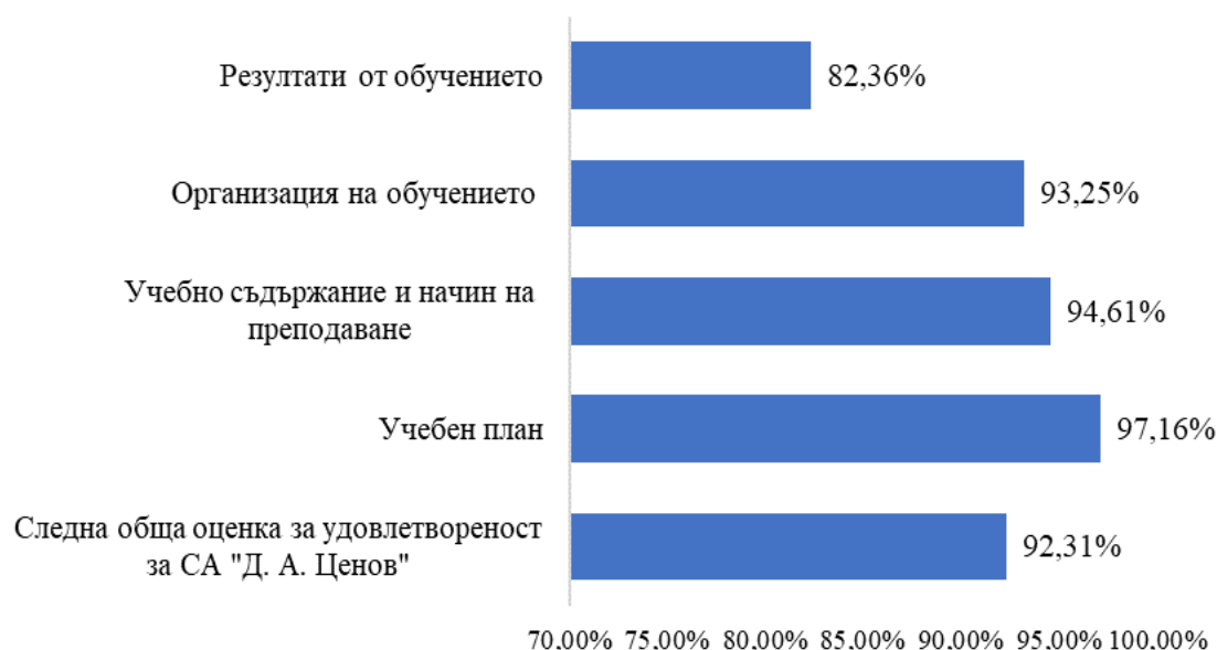
Фигура 3. Удовлетвореност на студентите от качеството на обучение в СА „Д. А. Ценов“ (по години)

Общото равнище на удовлетвореност на студентите през учебната 2023/2024 година е 92,31% (вж. фиг. 3).